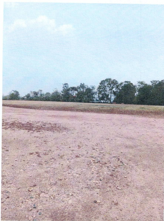
สนามกีฬาากลางเทศบาลตำบลจอมแจ้ง